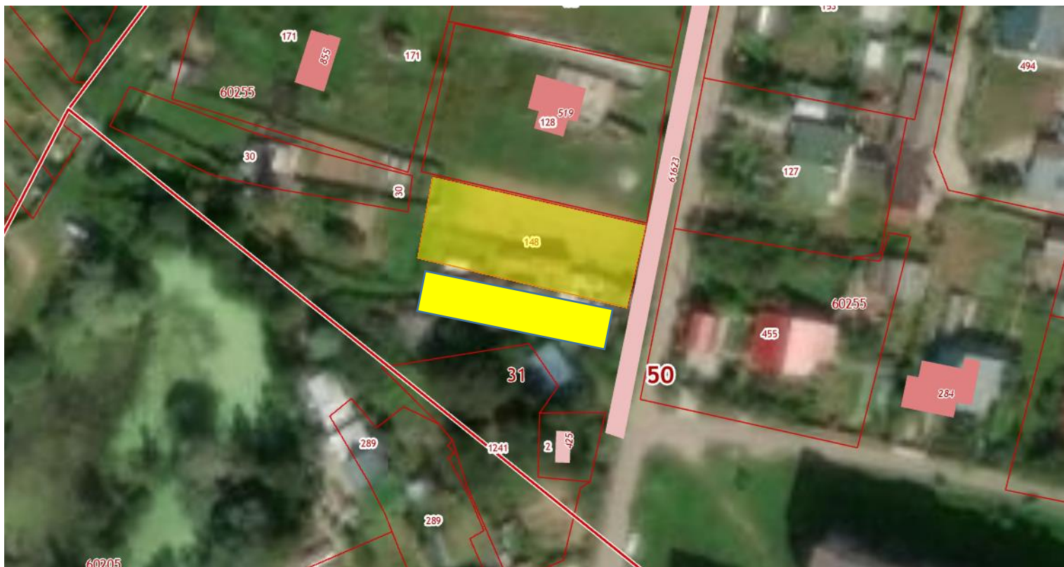
Нестационарные объекты «Хозяйственные постройки» Московская область, городской округ Чехов, д. Крюково, ул. Зеленая, вблизи д. 33А (вблизи з/у с КН: 50:31:0060255:148)