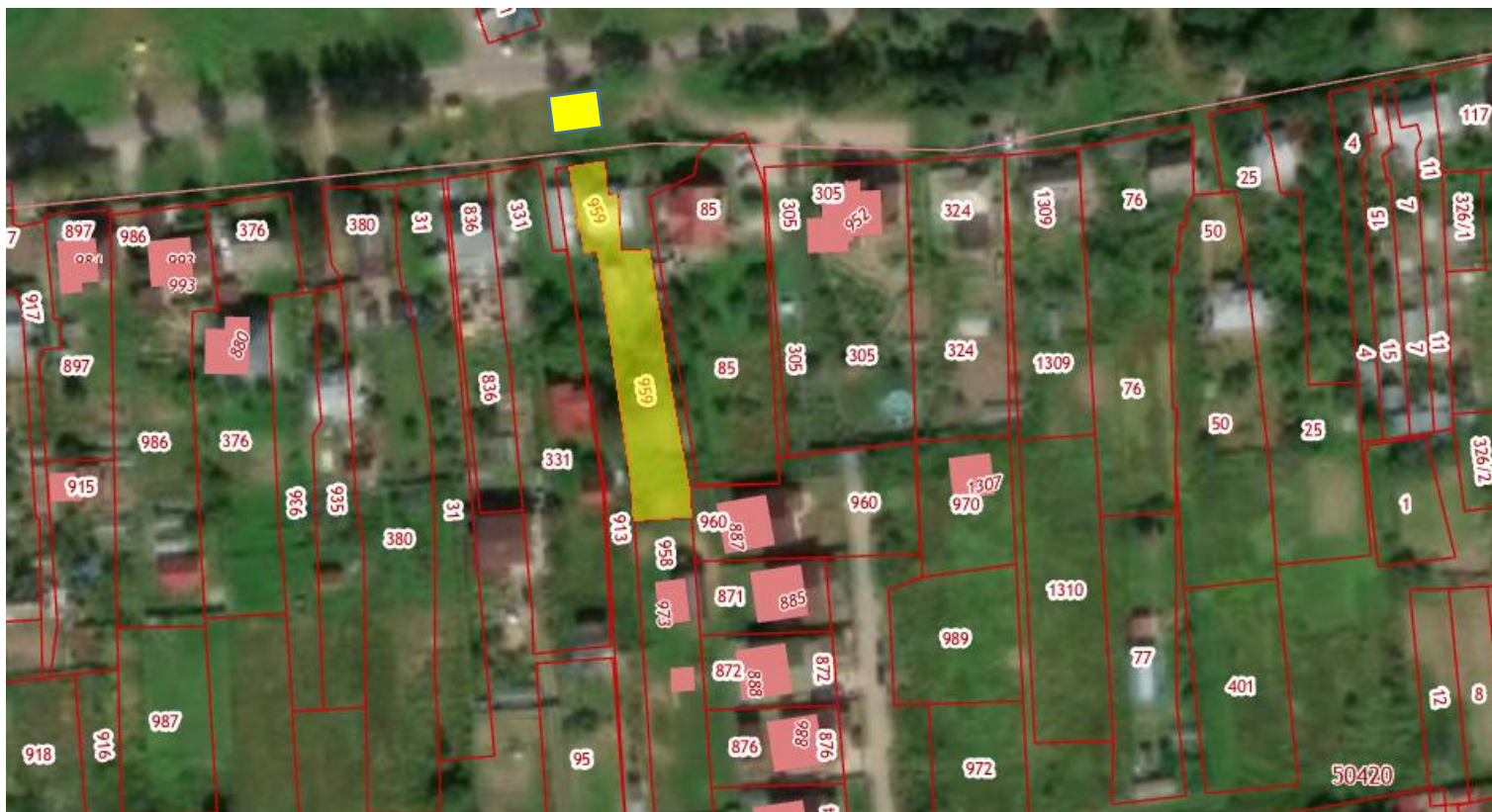
Нестационарный торговый объект «Павильон» Московская область, городской округ Чехов, д. Солнышково, вблизи д. 25 (вблизи з/у с КН: 50:31:0050420:959)